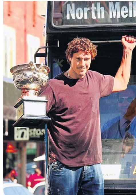
Start nach Mass. Am 25. Geburtstag ein Sieg gegen Federer und zwei Tage danach Australian-Open-Champion, doch danach passte für Marat Safin nicht mehr viel zusammen.

Nadal überholte in seinem phantastischen Jahr mit dem dynamischen Aufstieg ein halbes Hundert Cracks, so auch die lange am höchsten gehandelten Rivalen Federers wie Andy Roddick, Lleyton Hewitt und Marat Safin. Gerade Roddick geriet mit zunehmendem Saisonverlauf in eine Krise, die ihren Höhepunkt in Erstrunden-Knackouts in New York gegen den Luxemburger Gilles Muller und diese Woche in Madrid gegen Ivo Karlovic fand. Auch Safin und Hewitt, die beiden Protagonisten des Australian-Open-Finals in Melbourne, verloren nach dem starken Saisonauftakt