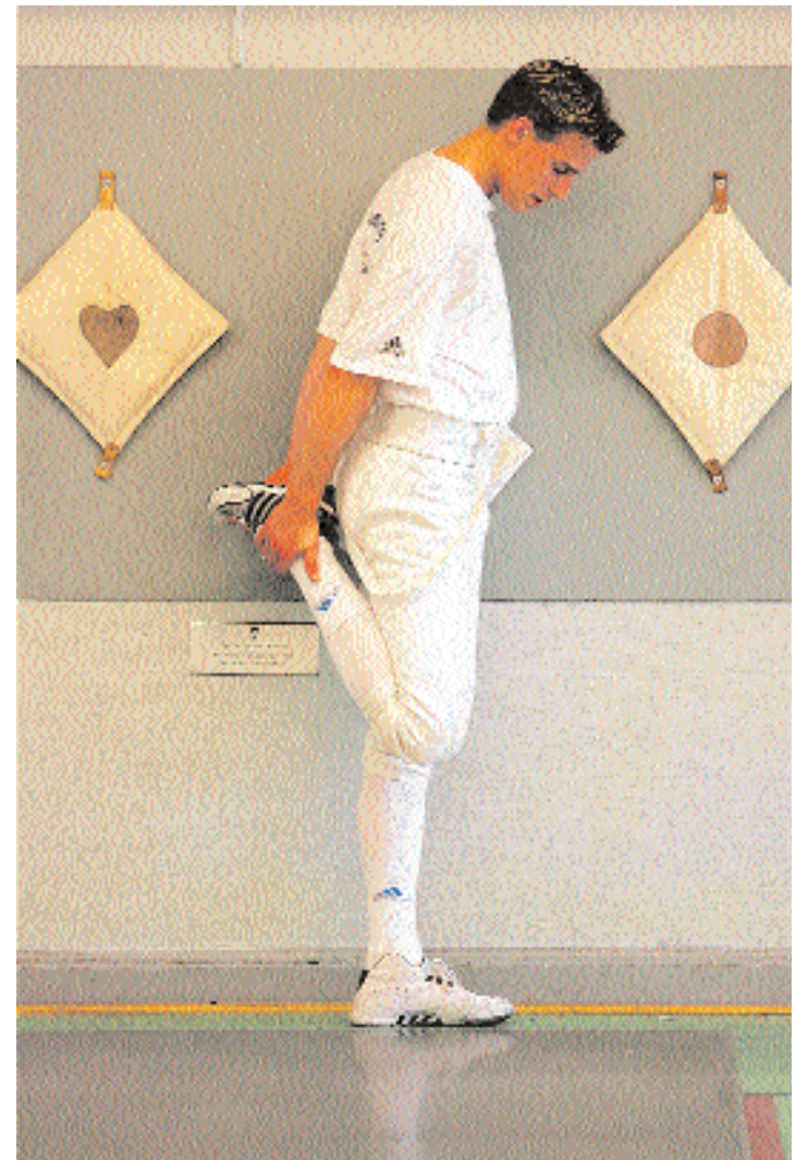
Quelques étirements avant de commencer, même si les jambes sont lourdes après une journée à l'hôpital.