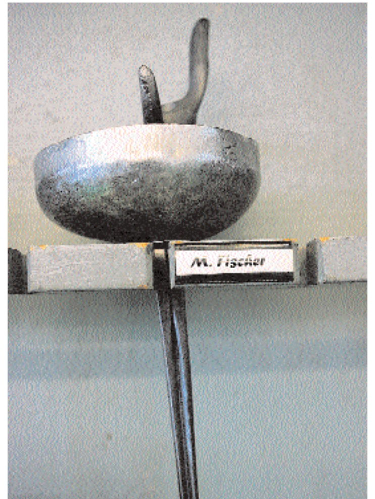
L'épée du champion n'attend que lui.